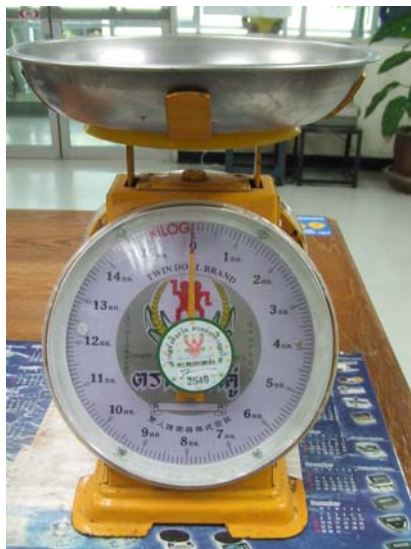
ภาพที่ 2 ภาพเครื่องชั่งที่ได้รับการตรวจรับรองเครื่องชั่งชั้นแรก และติดสติ๊กเกอร์ว่าเครื่องชั่งมีมาตรฐานเที่ยงตรงถูกต้องจากสำนักชั่งตวงวัด