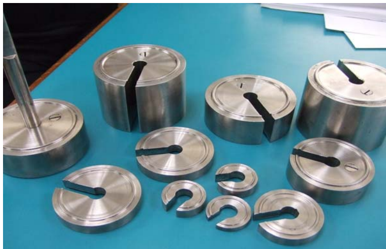
ภาพที่ 6 ภาพค้อนน้ำหนักแบบมาตรา เครื่องมืออนาถตรวจชั่งตวงวัดในการทดสอบน้ำหนักเครื่องชั่ง

เครื่องชั่งสปริงจะประทับไว้ทั้งหมด 10 จุด เพื่อป้องกันการแก้ไขส่วนที่เปิดออกได้เพื่อทำการแก้ไข ภายในซึ่งปรับไว้ถูกต้องดีแล้วให้มีน้ำหนักผิดไปจากเดิม ถ้าผู้ใช้เครื่องเปิดฝาปะกับข้างเพื่อแก้ไขจะ สังเกตได้จากตราครุฑที่ประทับป้องกันไว้จะชำรุดเสียหายหรือถูกทำลายทำให้ง่ายต่อการพิสูจน์ว่าเครื่อง ชั่งได้ถูกผู้ใช้แก้ไขภายใน