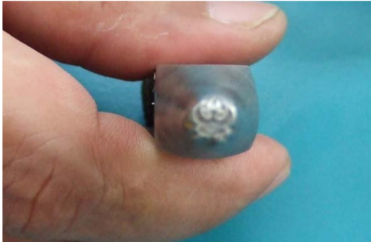
ภาพที่ 5 ภาพเครื่องหมายคำรับรอง (ตราครุฑ) ซึ่งนำไปตอกลงบนเครื่องชั่งเมื่อผ่านการตรวจรับรองแล้ว ส่วนใหญ่จะประทับไว้ที่หน้าปิด หรือคันชั่ง

เครื่องชั่งสปริงจะประทับไว้ทั้งหมด 10 จุด เพื่อป้องกันการแก้ไขส่วนที่เปิดออกได้เพื่อทำการแก้ไข ภายในซึ่งปรับไว้ถูกต้องดีแล้วให้มีน้ำหนักผิดไปจากเดิม ถ้าผู้ใช้เครื่องเปิดฝาปะกับข้างเพื่อแก้ไขจะ สังเกตได้จากตราครุฑที่ประทับป้องกันไว้จะชำรุดเสียหายหรือถูกทำลายทำให้ง่ายต่อการพิสูจน์ว่าเครื่อง ชั่งได้ถูกผู้ใช้แก้ไขภายใน