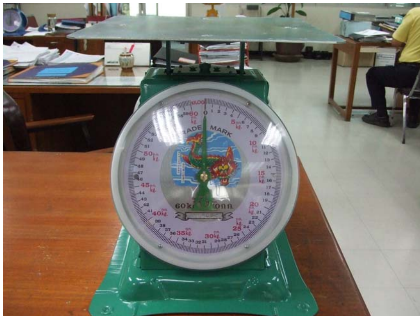
ภาพที่ 1 ภาพเครื่องซั้งที่ยังไม่มีการติดสติ๊กเกอร์ ว่าได้รับการตรวจรับรองเครื่องซั้งจากนายตรวจซั้งตวงวัด